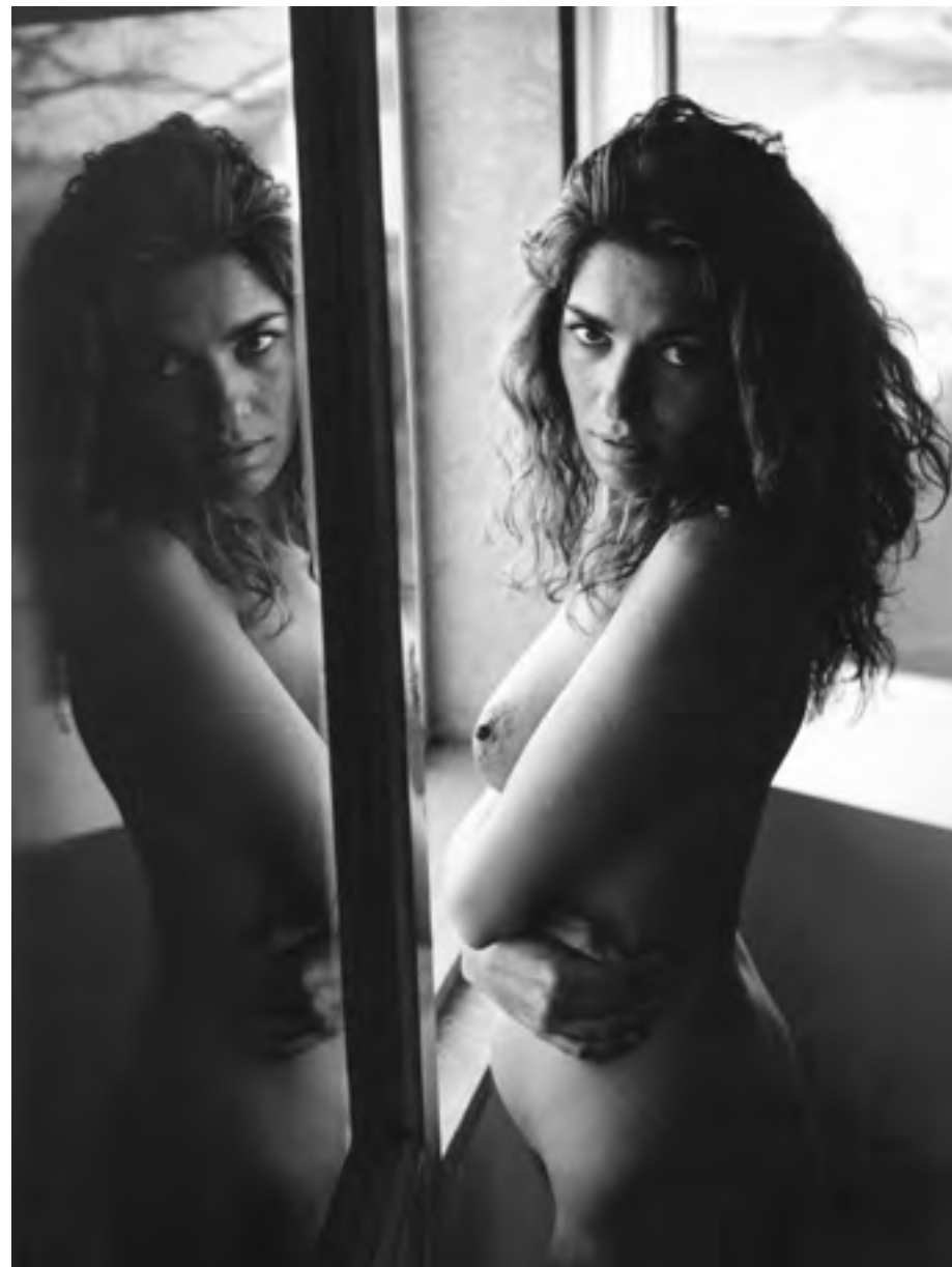
Ragusa, anni '90