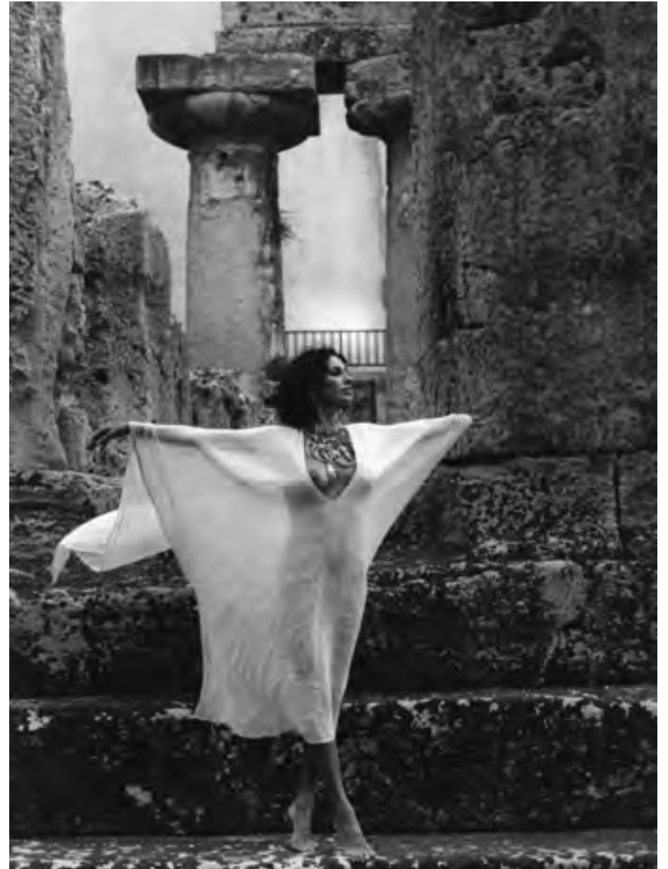
Siracusa, fine anni '90