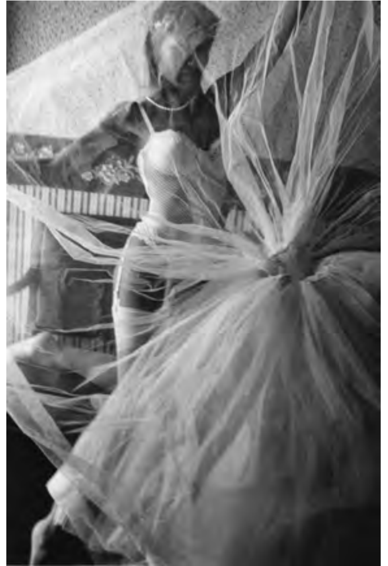
Ragusa, fine anni '90