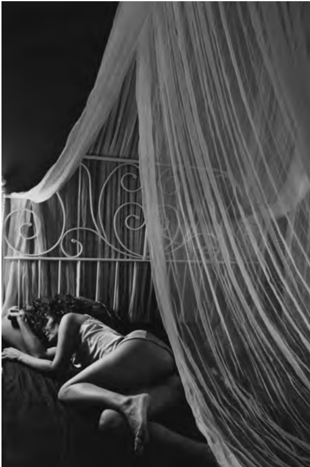
Pagina Successiva New York, 1999