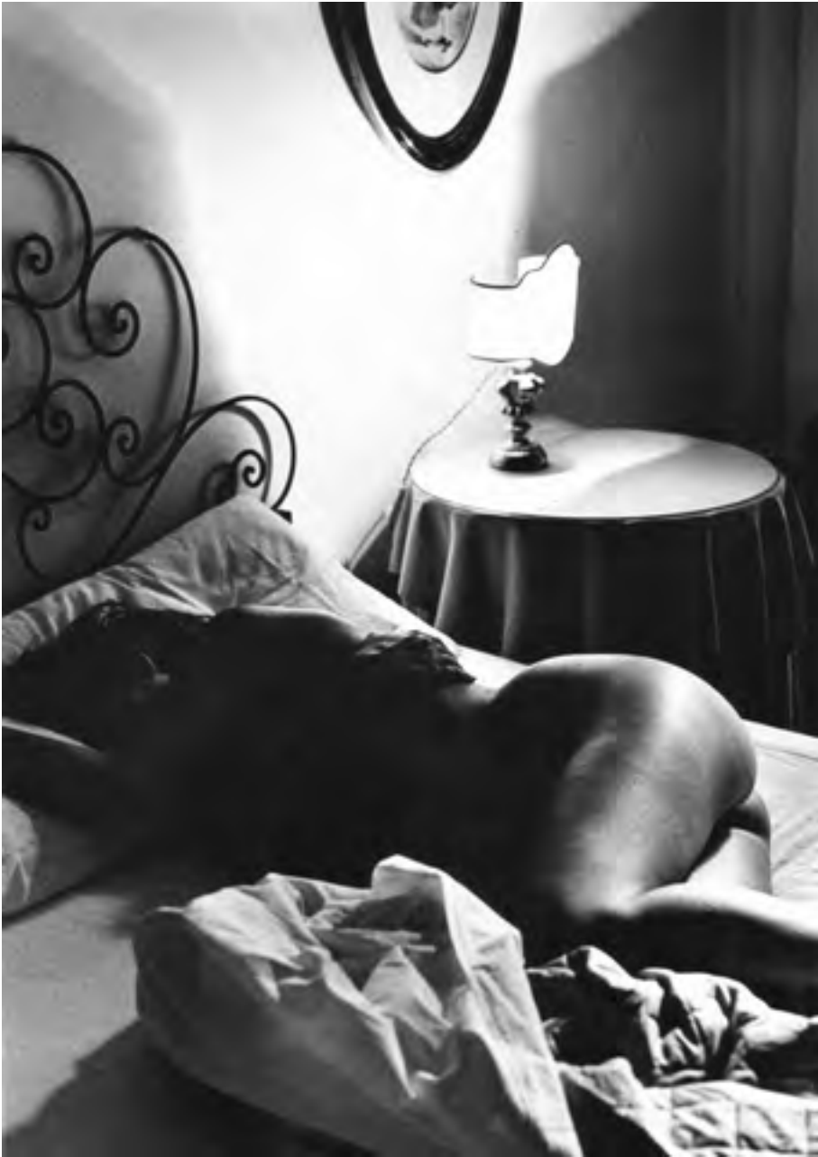
Noto, anni '90