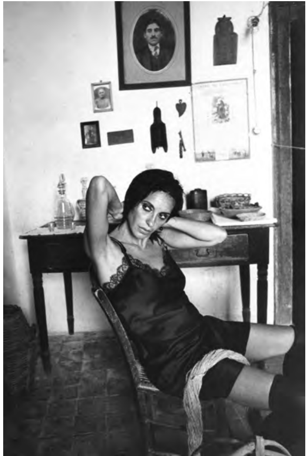
Palazzolo Acreide, anni '90