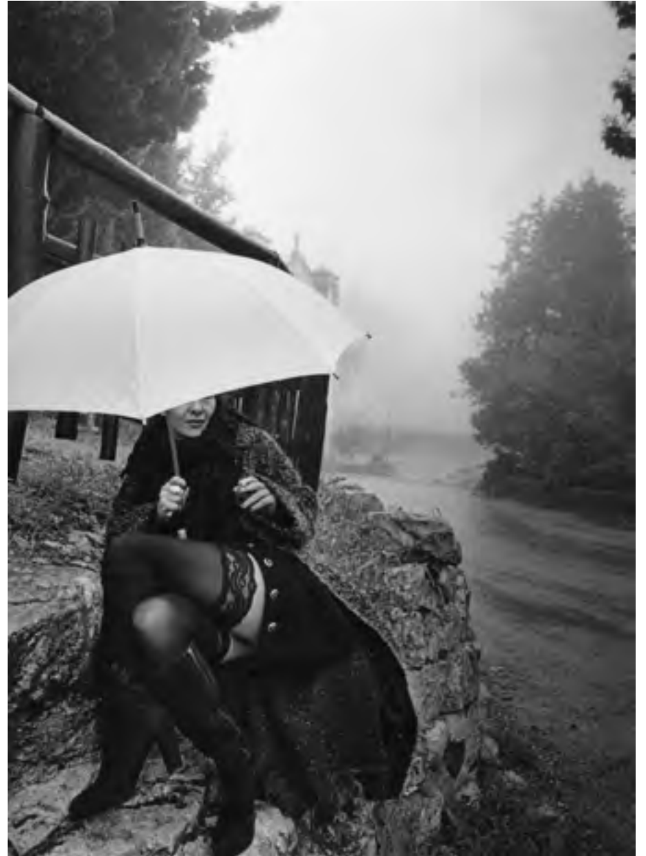
Chiaromonte Gulfi, 2015