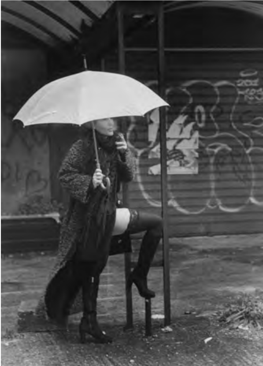
Chiaromonte Gulfi, 2015