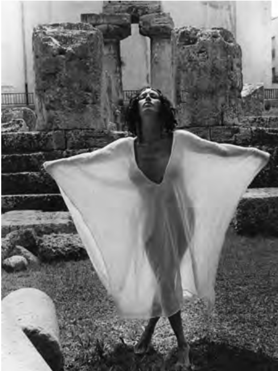
Siracusa, fine anni '90