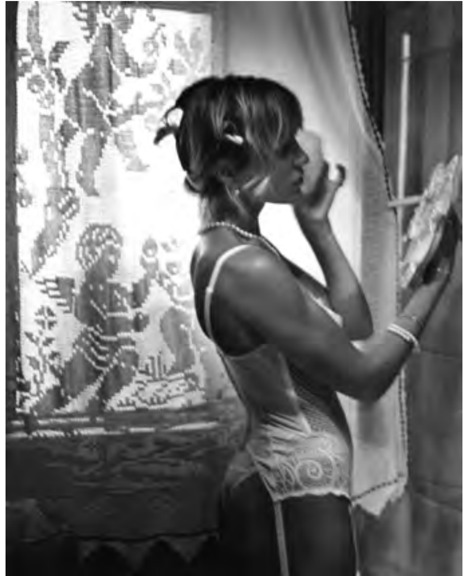
Ragusa, anni '90