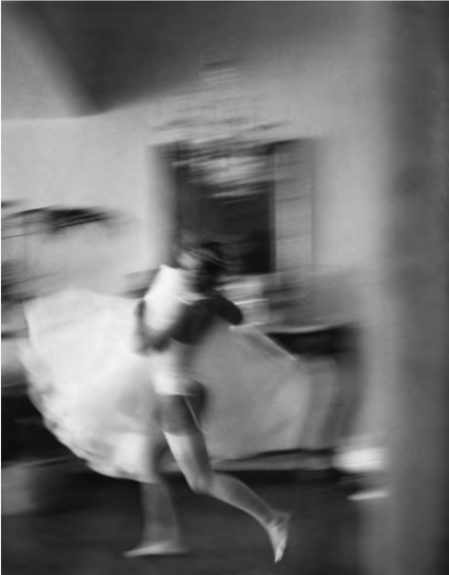
Ragusa, fine anni '90