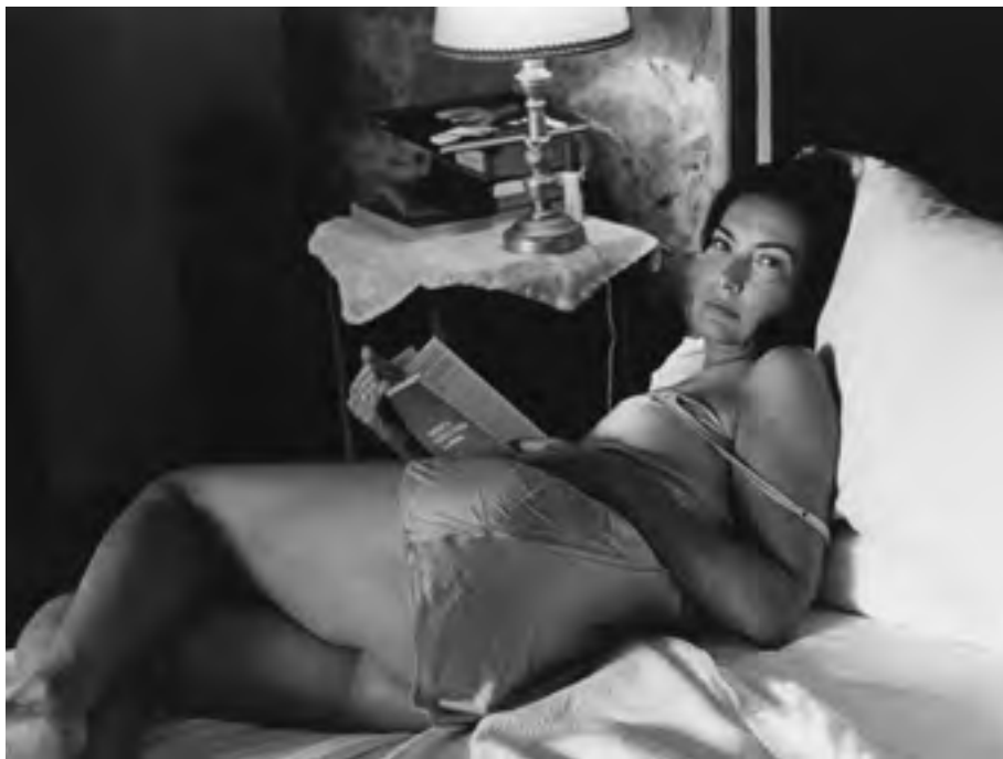
Castel di Lucio 2015